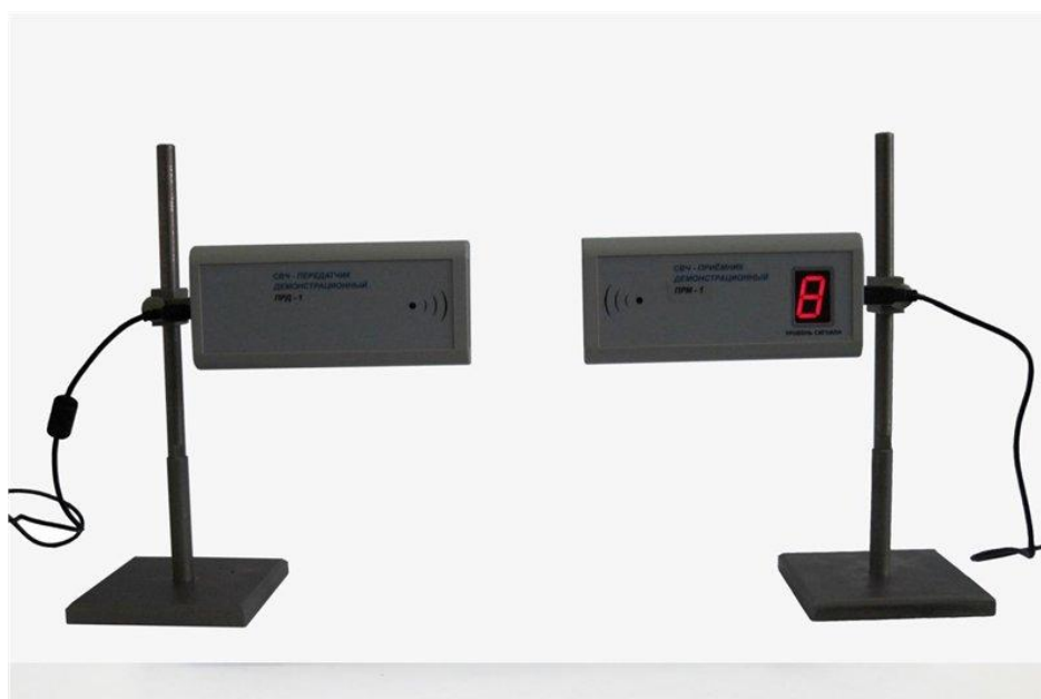
Рисунок 4 - СВЧ-приемник/передатчик демонстрационный