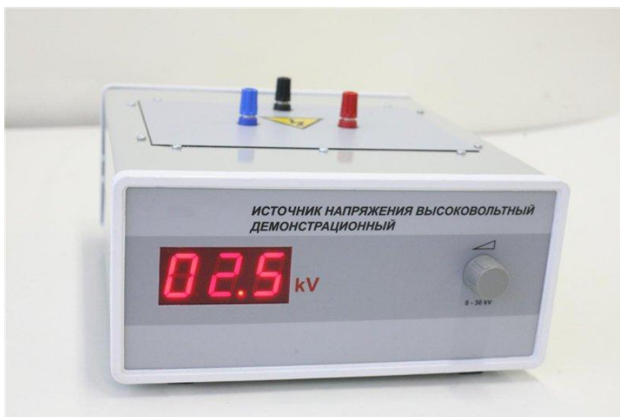
Рисунок 3 –Источник напряжения высоковольтный демонстрационный