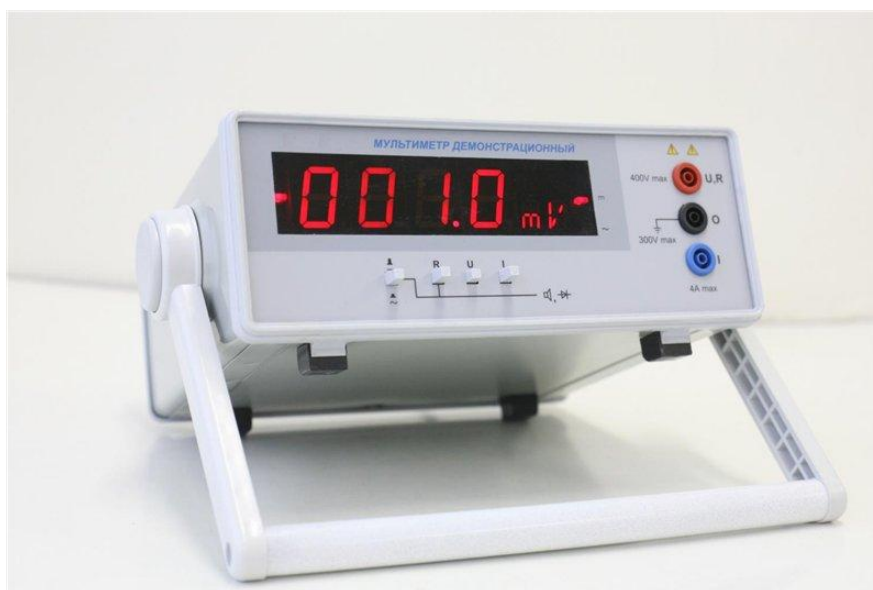
Рисунок 1 – Мультиметр демонстрационный

Внешний вид приборов, входящих в состав комплекта, представлен на рисунках 1 - 4.